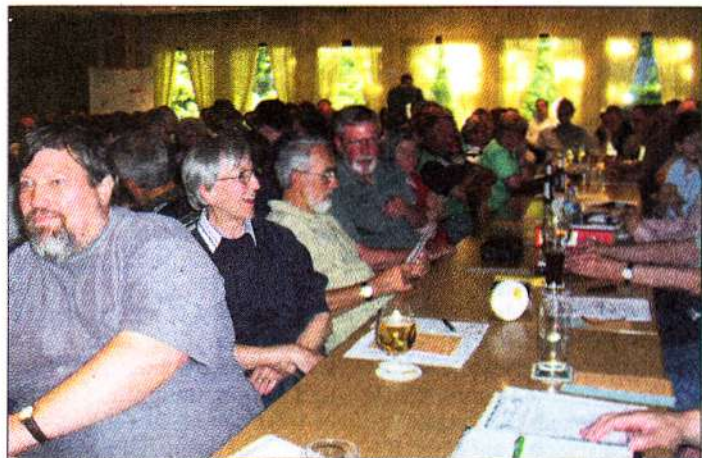
Eine lebhaftere Jahreshauptversammlung beim SV Lurup.